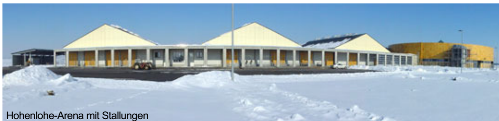
Hohenlohe-Arena mit Stallungen