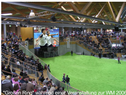
"Großen Ring" während einer Veranstaltung zur WM 2006