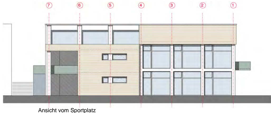
Ansicht vom Sportplatz

Das OG des Mensabereichs ist mit der Sporthalle über eine Faltwand verbunden. Für Sonderveranstaltungen (z.B. Musik- und Theateraufführungen) kann der höher liegende Mensabereich somit als Bühne genutzt werden. Der Sportraum dient in diesem Fall als Zuschauerraum. Über eine Rampe ist ein separater Abendzugang möglich.